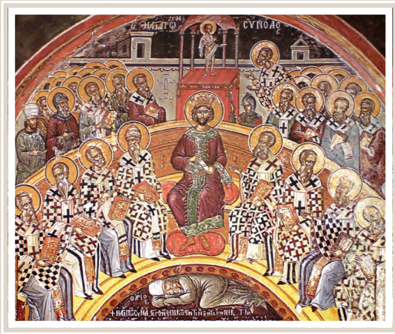
Ἡ πρώτη Οἰκουμένηκη Σύνοδος πού κατεδίκασε τόν ἀρειανισμό