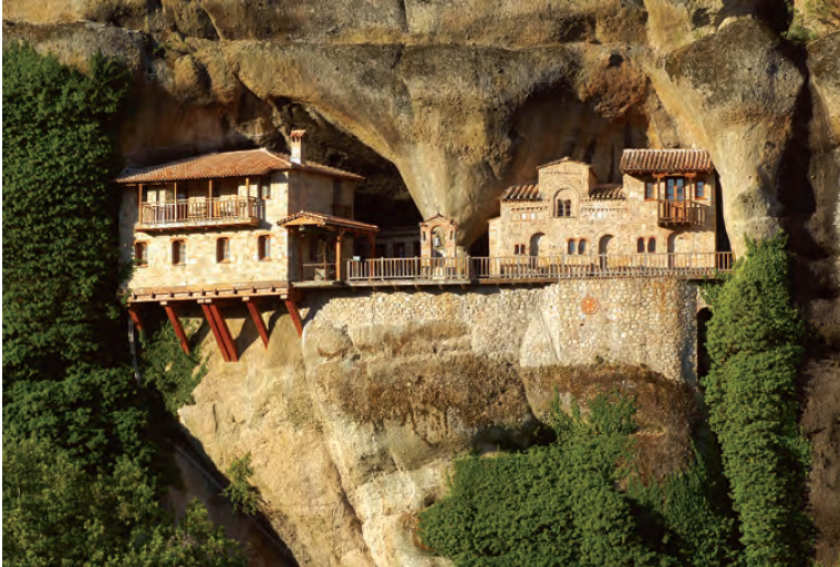
Ἱερά Μονή Ὑπαπαντῆς, Ἁγίων Μετεώρων